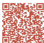
График приёма муниципальных депутатов на июль-август смотрите по ссылке

Связаться с Виталием Столяровым можно также через соцсети