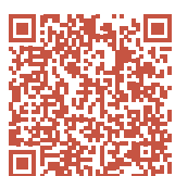
График приёма депутатов МО Красносельский – по этой ссылке